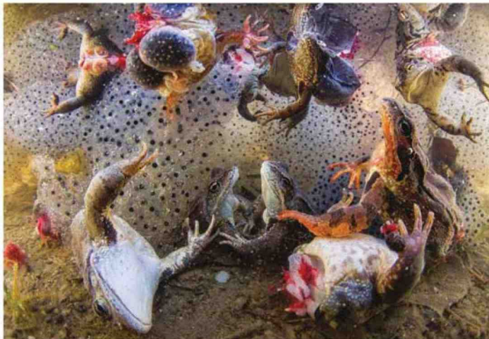
Harvesting Frogs' Legs Covasna, Eastern Carpathians, Romania

fortedibard.it f t fortedibard i forte_di_bard