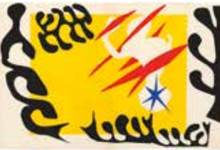
HENRI MATISSE Sulla scena dell'arte 7 luglio – 14 ottobre