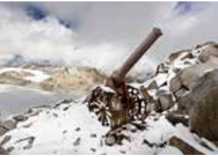
LA GUERRA BIANCA Fotografie di Stefano Torrione 29 marzo – 2 settembre