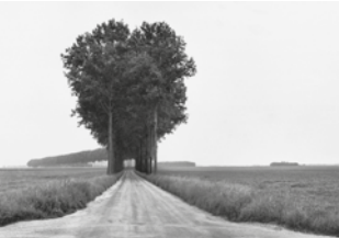
HENRI CARTIER-BRESSON Landscapes 17 giugno - 21 ottobre