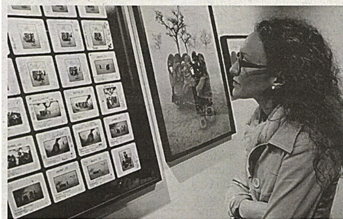
Dall'alto World Press Photo; Magnum Contact Sheets e a sinistra Napoleonica