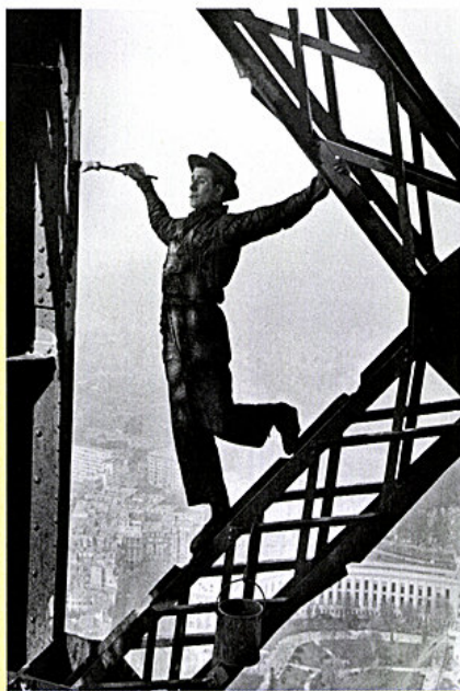
Eiffel Tower Painter. Paris, France, 1953

Un gruppo di donne si avvicinarono le une alle altre, per proteggersi dal vento. E cantavano. Mi affascinava quell'esistenza antica, in condizioni primitive».